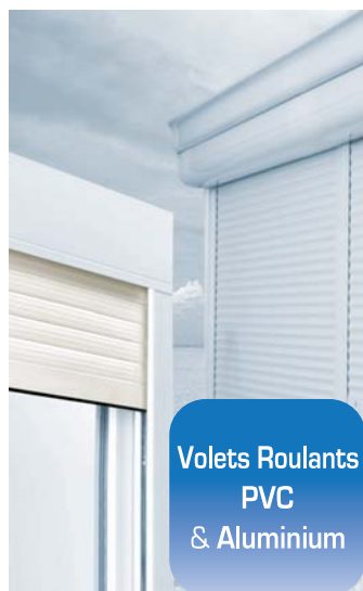
Volets Roulants PVC & Aluminium