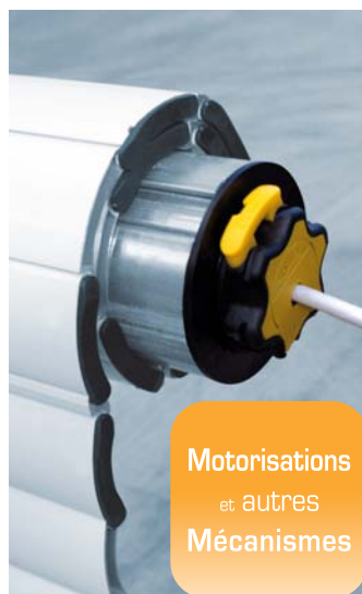
Motorisations et autres Mécanismes